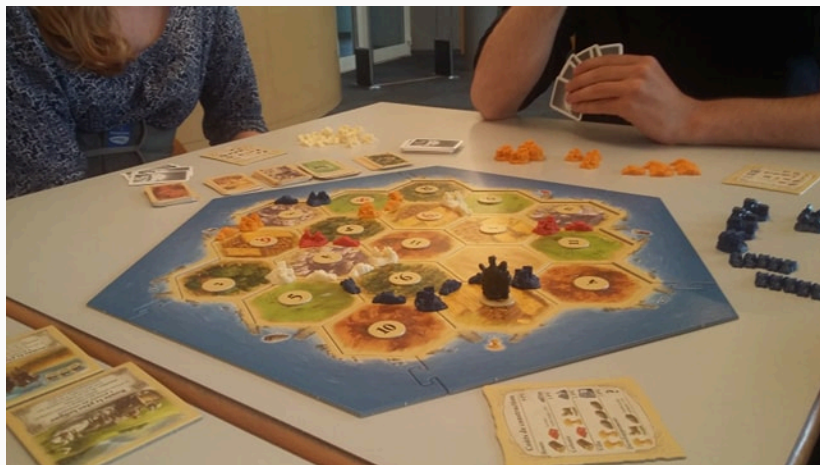
FIGURE – Plateau de jeu en cours de partie.