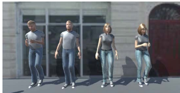
Figure 2: Exemples de 4 Personnages parmi les 8 profils.

Dans cette étude, nous avons voulu identifier et évaluer les facteurs les plus influents impliqués dans la prise de décision de descendre ou non d'un trottoir étroit. Nous avons donc élaboré des joutes urbaines 3D pour les présenter à des sujets afin de questionner leur ressenti et leurs motivations. Similairement à l'étude Maxime Charles [1], nous avons montré les joutes urbaines présentées pour l'observateur avec un point de vue correspondant à une position sur le trottoir opposé. Les 8 personnages (Figure 2) ont été réalisés grâce à AutoDesk Character Generator [19]. Nous avons ensuite utilisé Mixamo [20] pour associer les animations adaptées à chaque personnage.