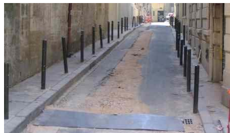
Figure 1: Exemple de trottoir étroit en France.

Les trottoirs sont le résultat d'héritages ou de conceptions d'infrastructures inadaptées pour les piétons (Figure 1). Dans ce contexte, lorsque deux piétons se croisent, l'un des deux doit descendre du trottoir pour laisser passer l'autre. Il s'expose alors au trafic routier, ce type d'aménagement pouvant ainsi être une source de danger potentiel. Ces face-à-face entre deux personnes sur trottoir étroit peuvent être qualifiés de joutes urbaines [1]. Ces situations d'infrastructure urbaine sont aujourd'hui sous-estimées, de même que les risques associés.