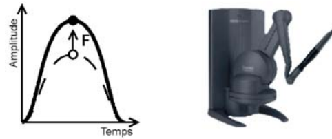
Figure 2 : Principe et périphérique utilisés pour donner une impulsion à l'utilisateur.

différentes. Ces tests n'ont pas pour but d'étudier un apprentissage mais une utilisabilité immédiate.