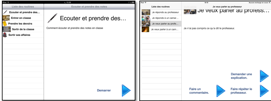
Figure 4 : Application Classroom Schedule+ déployée en classe ordinaire pour soutenir les routines et la communication en classe ordinaire

comportements (mesurés par des échelles standards – EQCA-VS 6 , SRS 7 ) que sur les processus cognitifs qui sous-tendent ces comportements (reconnaissance d’émotions, fluence émotionnelle, reconnaissance des visages, etc. ) (Fage et al., 2016). Les auteurs rapportent que ces résultats prometteurs sont certainement liés à l’association d’applications d’assistance et de remédiation, utilisées de concert dans une intervention globale impliquant à la fois les équipes pédagogiques et les parents.