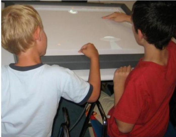
Figure 1. Enfants utilisant une technologie collaborative en classe spécialisée

Reprinted from “Dimensions of collaboration on a tabletop interface for children with autism spectrum disorder” by Giusti, L. Zancanaro, M., Gal, E., et al., 2011, Proceedings of the SIGCHI Conference on Human Factors in Computing Systems , 18, 591-617. Copyright 2011 by "Giusti, L.".