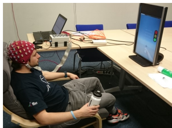
Figure 1 : Présentation générale du système Grasp'it : Le sujet génère des IMKs enregistrées via un casque EEG, le signal est analysé et traité, l'interface visuelle permet à l'utilisateur d'évaluer sa performance et l'invite à s'améliorer.

L'imagination motrice kinesthésique (IMK) est une tâche mentale qui consiste en la remémoration d'un mouvement en se focalisant non pas sur l'aspect visuel de l'exécution, mais principalement sur toutes les sensations proprioceptives qui accompagnent le mouvement réel (sensations de pression, chaleur, décharges électrique) [1]. L'IMK génère alors des modulations de l'activité cérébrale au niveau du cortex moteur pouvant être enregistrées grâce à la technique d'électroencéphalographie (EEG). De ce fait, l'IMK est de plus en plus utilisée dans le domaine des interfaces cerveau-ordinateur ( Brain-Computer Interface en anglais, ou BCI) en