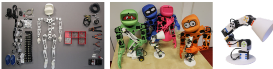
Fig. 1. Les trois formes de base : « Humanoïde », « Torso » et « Ergo Jr ».