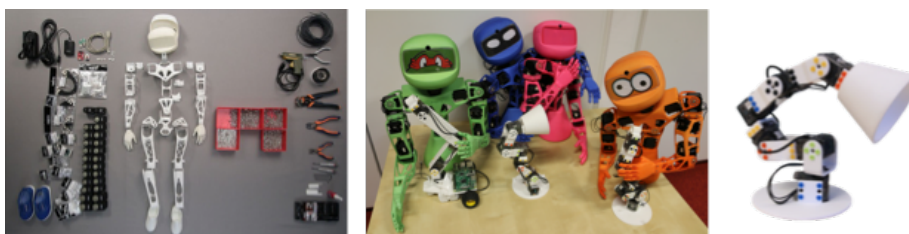
Fig. 1. Les trois formes de base : « Humanoïde », « Torso » et « Ergo Jr ».