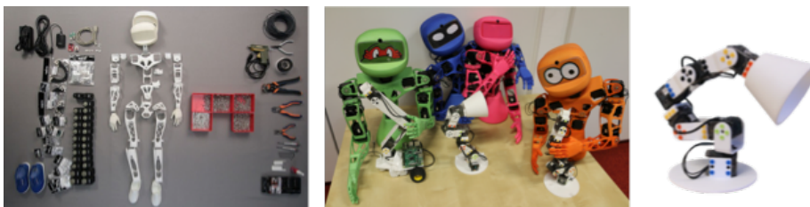
Fig. 1. La plateforme robotique Poppy, déclinée ici sous ses trois formes de base, « Humanoïde », « Torso » et « Ergo Jr ».

Les caractéristiques de la plateforme robotique Poppy ( https://www.poppy-project.org/fr/ )