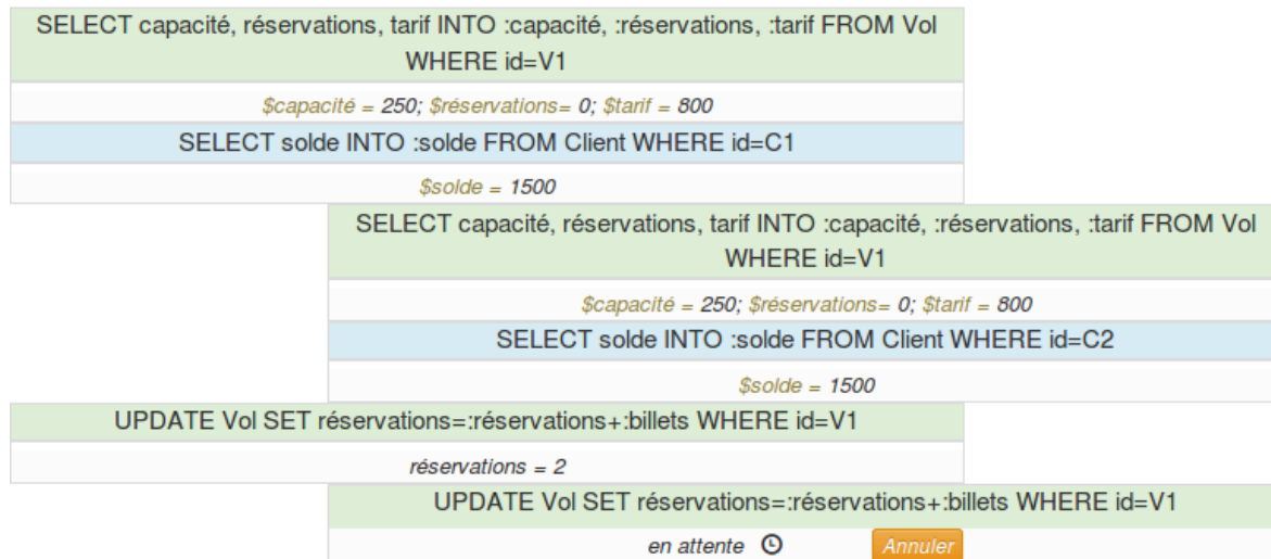
Fig. 2 : Les deux transactions veulent réserver au même moment un billet d'avion. Dans le niveau de sécurité Repeatable Read, le Update de la transaction 1 verrouille la table Vol. La transaction 2 est alors en attente.

try: # Select and return vol for connection connection_id getattr(self, "cursor_{0}".format(connection_id)).execute('SELECT id, placesDispo, placesPrises, tarif FROM vol') return getattr(self, "cursor_{0}".format(transaction_id)).fetchone() # timeout except _mysql_exceptions.OperationalError: self.set_status_unavailable_for(connection)