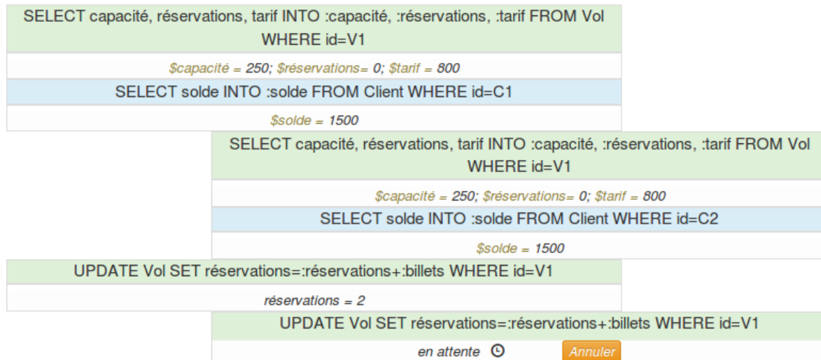
Fig. 2 : Les deux transactions veulent réserver au même moment un billet d'avion. Dans le niveau de sécurité Repeatable Read , le Update de la transaction 1 verrouille la table Vol . La transaction 2 est alors en attente.

dans le niveau d'isolation repeatable read