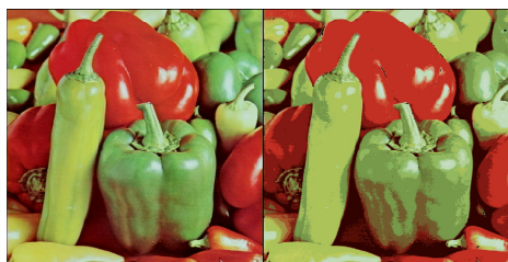
(d) "Peppers" originale et segmentée