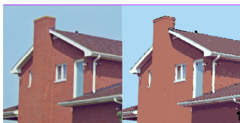
(a) "House" originale et segmentée

Pour bien visualiser les résultats de ce travail nous présentons ci-dessous les images originales et segmentées de "House", "Lena", "Monarch" et "Peppers" (Figures (a) à (d)). Le système de segmentation que nous avons proposé discrimine bien toutes les régions de l'image. Pour les images segmentées, les pixels classés reçoivent des étiquettes alors que ceux représentés en noir sont non classés. L'ensemble de ces pixels détermine le bruit dû à la méthode utilisée. Globalement, nous constatons que ce bruit ne change pas le contenu informationnel de l'image.