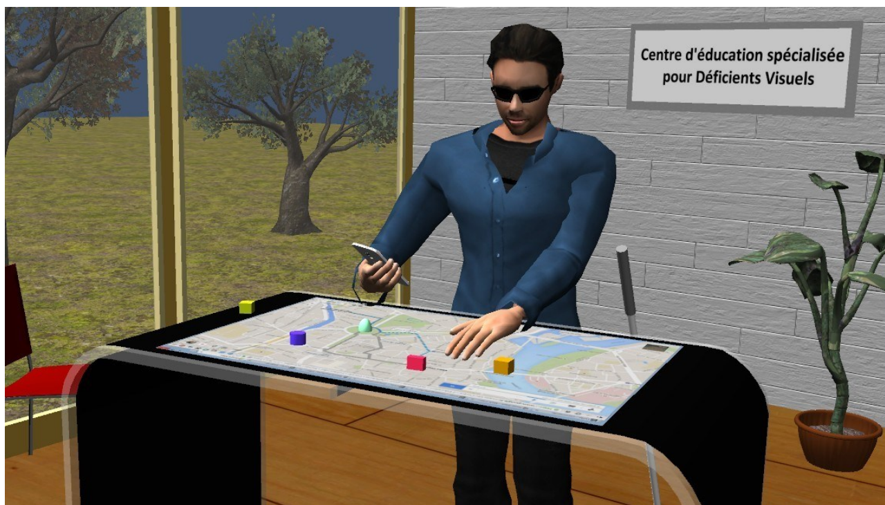
Figure 3: Projet AccessiMap : exploration tactile, tangible et multi-supports (par ex depuis son smartphone personnel) de données spatiales