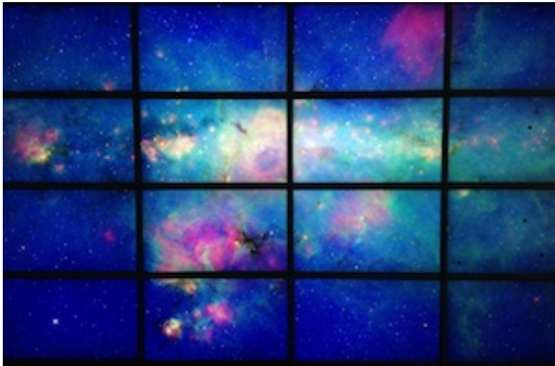
Imagen proveniente del telescopio Spitzer en ANDES (396032*27040 pixeles)