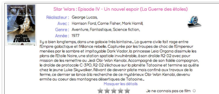
FIGURE 2 – Exemple de fiche détaillée pour un film donné lors de l'étape 2.

de l'étude sont donc implicitement répartis dans 5 groupes de taille égale, mais cela se fait de manière transparente de sorte qu'ils n'en ont pas conscience.