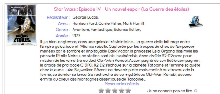
FIGURE 2 – Exemple de fiche détaillée pour un film donné lors de l'étape 2.

de l'étude sont donc implicitement répartis dans 5 groupes de taille égale, mais cela se fait de manière transparente de sorte qu'ils n'en ont pas conscience.