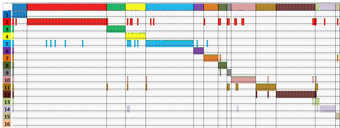
FIGURE 2: Communautés et indicateurs des recouvrements : Compte Facebook

les résultats ne peuvent être analysés et il apparaît des incohérences comme par exemple l'isolement de D (il y en a d'autres que nous ne discutons pas faute de place). À l'inverse grâce aux recouvrements et à l'association des deux ensembles d'entité une analyse fine peut être opérée. La suite de l'expérimentation portera sur l'extraction d'autres connaissances telles que le rôle du temps, du lieu ou de certains individus communs à différentes communautés. De même on pourra étudier l'exploitation de ces résultats pour la constitution d'albums et la diffusion des photos.