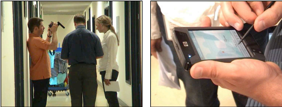
Images 1 et 2 : sujet (au centre en bleu) avec le facilitateur (à droite en blanc) et le caméraman (à gauche en orange) filmant l'écran du système MapMobile (image de droite) au cours de l'expérimentation.

L'expérimentation a concerné une douzaine de sujets dont seulement dix ont été effectivement inclus dans les analyses du fait de problèmes techniques ou organisationnels. Les sujets ont été sélectionnés de manière à être répartis selon les critères sociologiques de la méthode CAUTIC [Forest, Guilloux, Mallein, & Panisset, 1998]. Dans les faits, même si cela n'était pas recherché, l'expérience des sujets dans l'usage des nouvelles technologies ainsi que leur genre ont été également bien répartis. Les sujets étaient rémunérés. Les bâtiments de France Télécom Meylan R&D ont la forme de carrés, vides en leur centre, se joignant par les sommets sans marques distinctives. L'orientation à l'intérieur des bâtiments est particulièrement difficile, ce qui rendait le contexte d'expérimentation tout à fait réaliste 6 .