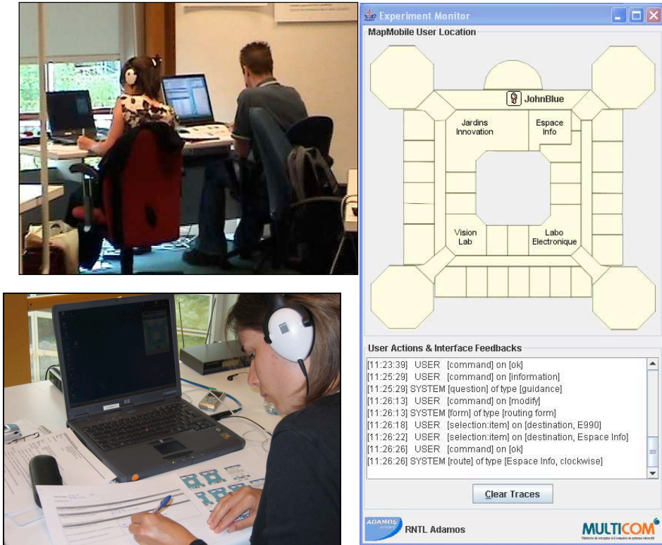
Images 3, 4 et 5 : sur l'image en haut à gauche, régie permettant le recueil des traces « terrain » (à gauche) et « situation réelle » simulée (à droite). Sur l'image en bas à gauche, ergonomiste effectuant les annotations au fil de l'eau. Sur l'image de droite, copie d'écran des traces « situation réelle » recueillies pendant l'expérimentation.

Les résultats dits « situation réelle » ont été obtenus à partir des traces informatiques collectées sur le dispositif. Les traces étaient transmises en temps réel par le réseau sans fil via un bus de données développé spécifiquement (Usybus basé sur Ivy [Buisson et al., 2002]). Les traces collectées étaient :