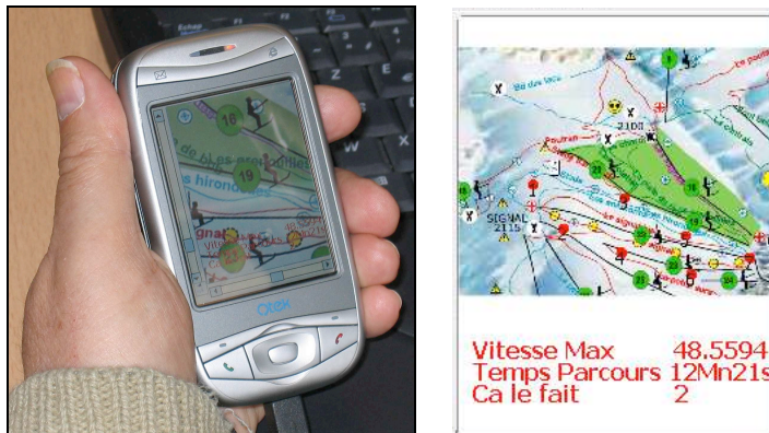
Images 9 et 10 : Écran du téléphone mobile implémentant l'interface de restitution (à gauche) et copie d'écran de cette interface (à droite).

Techniquement, le service E-skiing était composé d'un ensemble de capteurs associés à des enregistreurs autonomes (vidéo, accélération, et position géographique) portés par les skieurs et d'une interface de restitution (téléphone mobile de type « smartphone ») qu'ils emmenaient aussi avec eux (cf. images 6 à 10). En back-office, nous disposons de deux ordinateurs portables destinés à traiter les données et d'un serveur de données permettant de mettre à disposition les données une fois traitées. La récupération des données s'effectuait à la fin de chacune des descentes car les enregistreurs autonomes n'avaient pas la capacité de se connecter sans fil. Par contre,