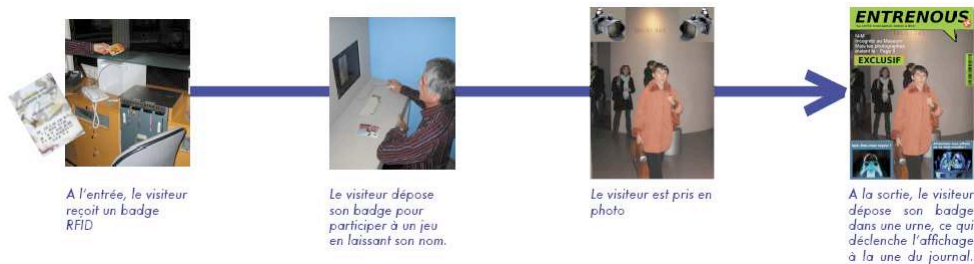
Figure 1 : Étapes du traçage des visiteurs dans l'exposition « ni vu – ni connu ».

Notre objectif, par rapport à la précédente expérimentation E-skiing, était de prouver la possibilité de passage à l'échelle des expérimentations en situation réelle. Nous avons donc augmenté la durée de l'expérimentation : quelques semaines au lieu d'une seule journée pour les skieurs. Nous avons aussi augmenté le nombre d'utilisateurs : plusieurs centaines de visiteurs au lieu d'un seul groupe de quatre skieurs. Cela nous a permis d'obtenir des résultats statistiquement exploitables.