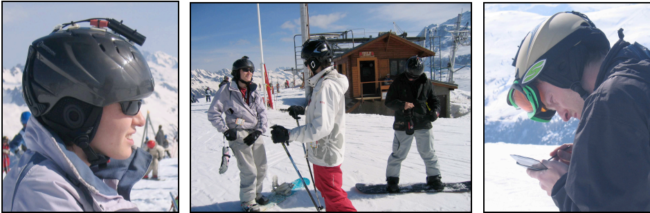
Images 6, 7 et 8 : Casque équipé d'une mini-caméra et d'un accéléromètre (à gauche), téléphone mobile implémentant l'interface de restitution mobile (à droite) et groupe de skieurs équipés (au centre).

étaient invités à aller skier comme ils en avaient l'habitude, puis à revenir au local en bas des pistes après chaque descente (pour le chargement des données). Il s'agissait d'une expérimentation en situation réelle car les skieurs étaient libres d'effectuer les activités qu'ils désiraient et n'étaient pas accompagnés d'observateurs. L'expérimentation a mobilisé cinq skieurs dont quatre étaient équipés du service. Dans une seconde partie de l'expérimentation, qui n'est pas l'objet de cet article, les skieurs ont été conviés à une réunion sous forme de soirée conviviale de type « focus-group » où la version sédentaire du service leur était présentée, celle qui est destinée à être utilisée à la maison. Cette réunion avait également pour objectif d'obtenir un retour sur les aspects ergonomiques du système et sur l'usage qu'ils avaient fait du service proposé.