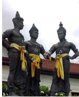
FIG. 1 – Les trois princes de Serendip.