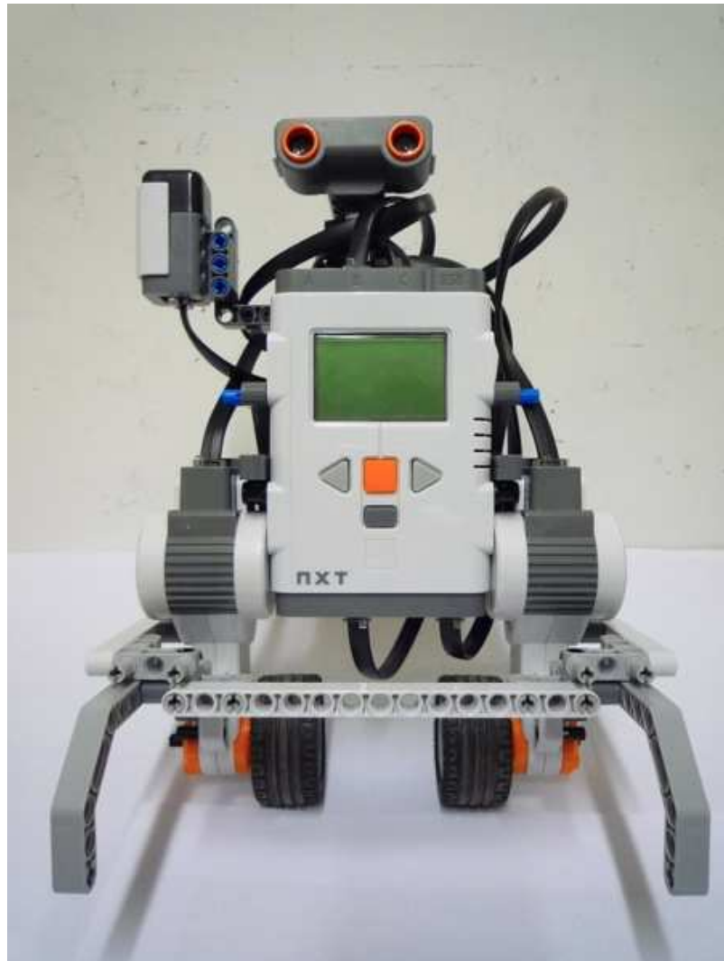
Figure 1 • Le robot gyropode

Dans le cadre de ces modules de projets, les étudiants de 2 ème année ont eu à choisir parmi 11 sujets tandis que ceux de 3 ème année ont eu à choisir parmi 10 sujets. Afin de faciliter la mise en œuvre des modules correspondants et l'évaluation des étudiants, les sujets sont dédoublés; c'est-à-dire qu'un même sujet peut être affecté à deux groupes différents. Pour l'année universitaire 2009-2010, parmi les sujets proposés, trois sujets visaient l'utilisation des robots comme support :