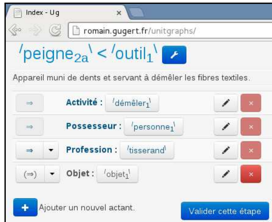
(a) Phase 1 : Sélection de la structure actancielle.

Initialement adaptées aux lexicographes, les étapes 1 et 2 peuvent être réutilisées dans un autre contexte d'IC. Par ailleurs, une évolution de ce prototype devrait guider l'utilisateur dans l'élaboration de la structure actancielle en même temps qu'il manipule le graphe de définition.