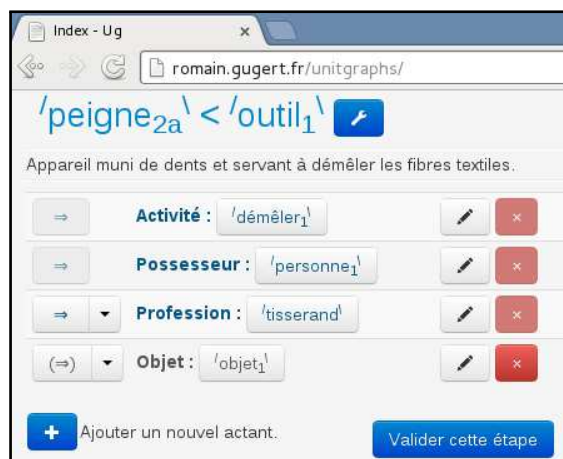
(a) Phase 1 : Sélection de la structure actancielle.

Initialement adaptées aux lexicographes, les étapes 1 et 2 peuvent être réutilisées dans un autre contexte d’IC. Par ailleurs, une évolution de ce prototype devrait guider l’utilisateur dans l’élaboration de la structure actancielle en même temps qu’il manipule le graphe de définition.