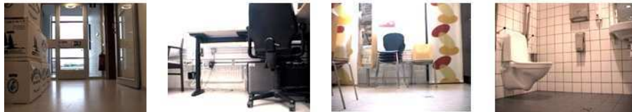
Figure 2. Exemple des images de la collection RobotVision. L'ensemble d'apprentissage est pris dans la condition de nuit. Tandis que l'ensemble de validation est pris dans la condition de jour. Pour le test, la condition est inconnue en ajoutant une nouvelle pièce et des objets qui ne sont pas appris à priori.

sage, validation et test) est très grande. Ca pourrait diminuer fortement la performance du système de reconnaissance. Pour cela, nous présentons la solution dans la partie qui suit.