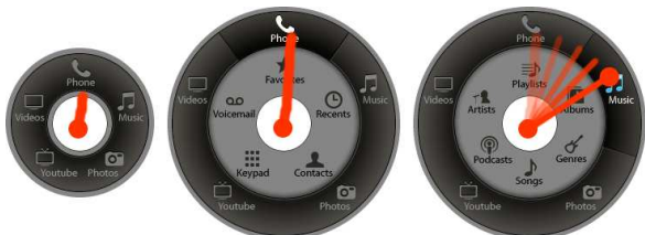
Figure 2 : A l’aide d’un mouvement circulaire, l’utilisateur peut prévisualiser les différentes catégories multimédia.

Le Wavelet menu est une adaptation du Wave menu pour dispositifs mobiles. Notre prototype a été conçu pour explorer les catégories multimédia et naviguer dans les longues listes de données. Le menu apparaît au centre de l’écran (Fig. 1-a) et contient cinq items pour les différents types de données multimédia fréquents : Music, Photos, Youtube, Videos et Phone. D’autres types de données peuvent être ajoutés si nécessaire car le menu racine peut contenir jusqu’à huit items. Le second niveau du menu contient de trois à huit sous-catégories selon l’item parent sélectionné. Par exemple, la catégorie Music (Fig. 1) est divisée en : Albums, Genres, Songs, Podcasts, Artists et Playlists.