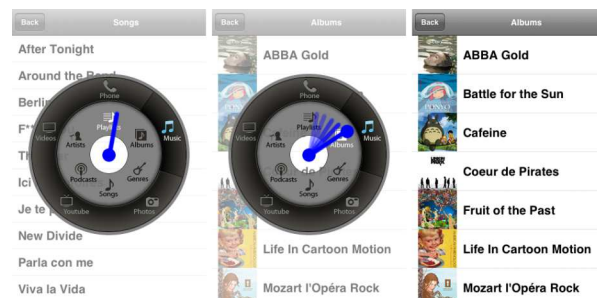
Figure 3 : Gestion de longues listes linéaires avec le Wavelet menu.

avec cette liste comme il le ferait sur iPhone (défilement, sélection, etc.).