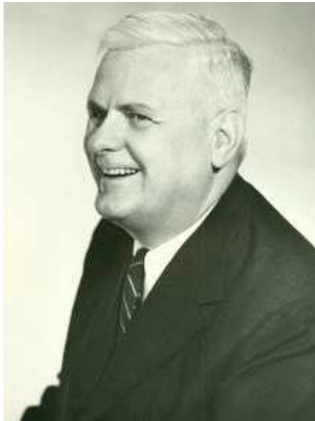
Alonzo Church (1903–1995)

Dites lui bien que les ordinateurs ne font pas plus que ça, car c'est vrai. De manière fabuleusement rapide et avec des algorithmes fabuleusement plus longs, certes. Mais pas plus. Ce que nous disons ici est une forme popularisée de la thèse de Church-Turing qui fonde la science informatique. Mais ne l'embêtez pas [encore] avec ça :-).