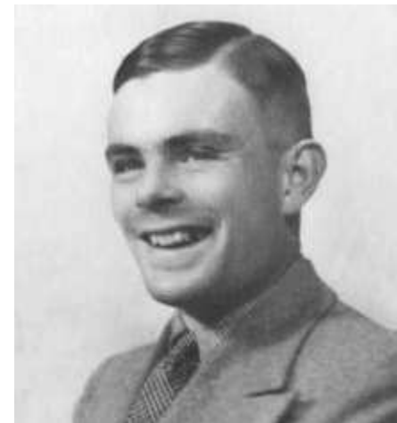
Alan Turing (1912-1954)