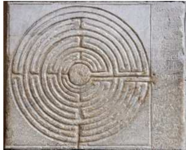
Labyrinthe digital situé à l'entrée de la cathédrale de Lucques en Italie