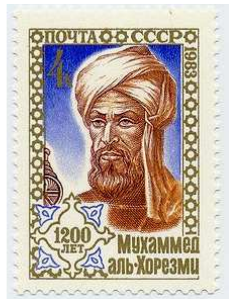
Al-Khwarizmi (env. 783, env. 850)

Ce jeu du « robot-idiot » n'est pas du tout original, il correspond