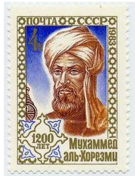
Al-Khwarizmi (env. 783, env. 850)

Ce jeu du « robot-idiot » n'est pas du tout original, il correspond