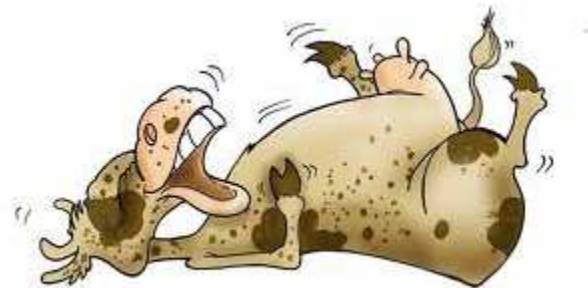
Ce qui arrivera en cas de bug !

On fabriquera des petites cartes à jouer en découpant un vieux carton en petits carrés avec les mots « avancer », « gauche », « droite ». Et on lui donnera une séquence de ces cartes qui sera son « algorithme ». Il devra exécuter cet algorithme sans « réfléchir » (gare au mur - et à la rigolade - s'il y a un bug !). Ensuite on aura sûrement envie de ne pas répéter « avance d'un pas, avance d'un pas » mais « avance de trois pas ». Donc l'instruction aura une valeur variable