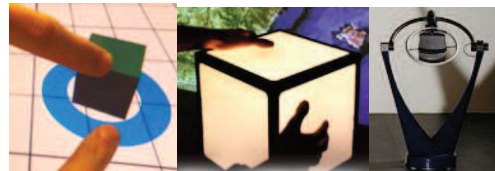
Figure 1. – De gauche à droite : interaction directe sur une table tactile, le Cubtile [3], le CAT [4].

D'autres expériences ont été menées avec des interfaces de contrôle dissocié du rendu (i.e. indirectes) (figure 1). Celles-ci sont fixes ou peu mobiles, mais permettent tout de même de dissocier les DDL [3] [4].