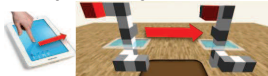
Figure 4. – la translation de l'objet virtuel se fait selon l'orientation du plan formé par la tablette et selon la vitesse de déplacement du doigt.

Afin de ne pas surcharger mentalement l'utilisateur lors d'une tâche de manipulation, il peut, à tout moment, désactiver ou réactiver les rotations appliquées à l'objet virtuel. Tout comme l'utilisation de l'interface avec la souris, l'utilisateur peut se focaliser sur un nombre de DDL plus restreint (passer de 6DDL à 3DDL). Une vibration ainsi qu'un changement de couleur permet de connaître simplement le changement de mode.