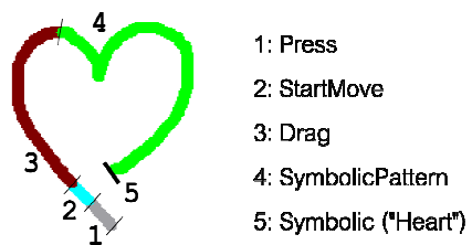
Figure 1: séquence de primitives en réponse à un geste

DGIL est à la fois un moteur de reconnaissance de gestes tactiles puissant, capable de reconnaître des gestes symboliques formés d'un ou de plusieurs traits (lettres, chiffres, symboles variés), et également un framework d'interaction gestuelle tactile complet, développé en C++ et doté d'une API Java. Sa modélisation repose sur une machine à états cadencée par le temps et sur plusieurs sous-systèmes d'analyse de la dynamique du geste dont un module de reconnaissance de formes basé sur une approche probabiliste. La philosophie de DGIL réside dans une approche unifiée du geste, où le moindre événement tactile (de type mono point) capturé par la dalle sensible est considéré a priori comme un geste ou une partie d'un geste intentionnel. Ainsi, un simple « tap » est un geste au même titre qu'un geste symbolique représentant une forme complexe. Dans cette approche, les caractéristiques physiques du geste sont analysées, y compris le temps, ce qui permet de prendre en compte sa dynamique. La finalité de DGIL est alors de fournir à l'interface utilisateur, et en temps réel, une description syntaxique fine du geste, sous la forme d'une séquence de primitives gestuelles accompagnée de paramètres que l'on peut connecter aux commandes et feedbacks de l'interface. La Figure 1 illustre une séquence produite par le moteur dans le cas d'une interface faisant coexister des gestes symboliques avec des gestes standards de manipulation.