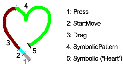
Figure 1: séquence de primitives en réponse à un geste

DGIL est à la fois un moteur de reconnaissance de gestes tactiles puissant, capable de reconnaître des gestes symboliques formés d'un ou de plusieurs traits (lettres, chiffres, symboles variés), et également un framework d'interaction gestuelle tactile complet, développé en C++ et doté d'une API Java. Sa modélisation repose sur une machine à états cadencée par le temps et sur plusieurs sous-systèmes d'analyse de la dynamique du geste dont un module de reconnaissance de formes basé sur une approche probabiliste. La philosophie de DGIL réside dans une approche unifiée du geste, où le moindre événement tactile (de type mono point) capturé par la dalle sensible est considéré a priori comme un geste ou une partie d'un geste intentionnel. Ainsi, un simple « tap » est un geste au même titre qu'un geste symbolique représentant une forme complexe. Dans cette approche, les caractéristiques physiques du geste sont analysées, y compris le temps, ce qui permet de prendre en compte sa dynamique. La finalité de DGIL est alors de fournir à l'interface utilisateur, et en temps réel, une description syntaxique fine du geste, sous la forme d'une séquence de primitives gestuelles accompagnée de paramètres que l'on peut connecter aux commandes et feedbacks de l'interface. La Figure 1 illustre une séquence produite par le moteur dans le cas d'une interface faisant coexister des gestes symboliques avec des gestes standards de manipulation.