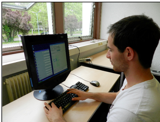
Figure 1 : Démonstrateur en fonctionnement.

Afin de valider la faisabilité de l'approche, nous avons développé un démonstrateur (figure 1). Celui-ci a été réalisé de manière à rendre l'expérience utilisateur quasi-identique à celle d'un système interactif classique. En effet, hormis la phase de calibration de l'oculomètre (Tobii 1750), l'interaction avec le système n'est pas différente. Ce démonstrateur a été implanté principalement en Java (à l'exception de l'interface avec l'oculomètre implanté en C#) selon une architecture multi-agents.