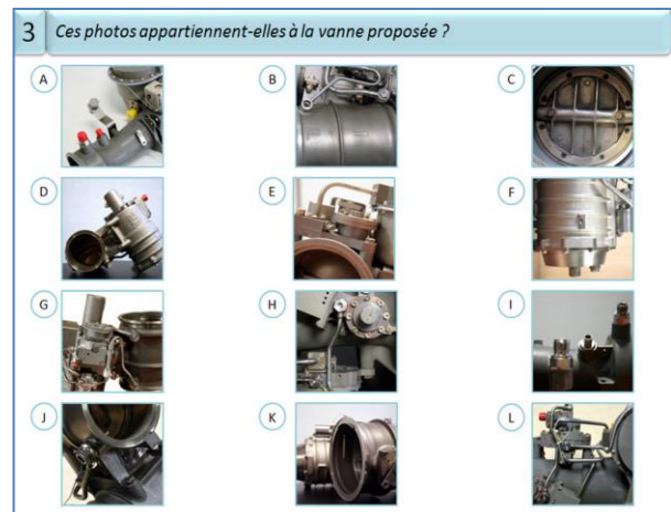
Figure 3 : Écran de consignes - épreuve III