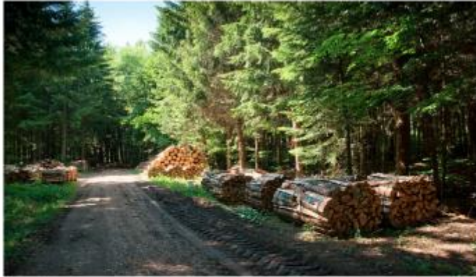
Figure 1 Exploitation de forêt

Alain Rapaport (INRA Montpellier), Jean-Philippe Terreaux (IRSTEA Bordeaux)