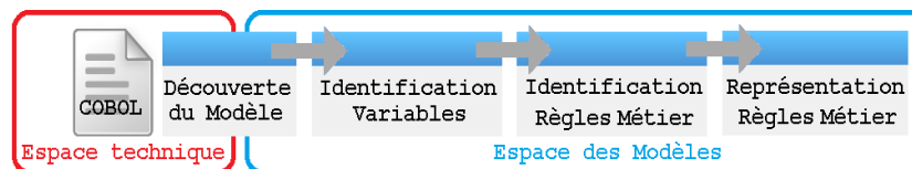
Figure 1: vue d'ensemble du Framework

Le framework (fig. 1) est composé par les trois principales étapes d'un processus BREX (Identification des Variables, Identification et Représentation des Règles Métier) plus une étape supplémentaire utilisée pour passer de l'espace technique défini par le langage du système à l'espace des modèles. Cette dernière étape est réalisée en utilisant le COBOL Application Model 2 d'IBM Rational Developer for System z 3 (RDZ).