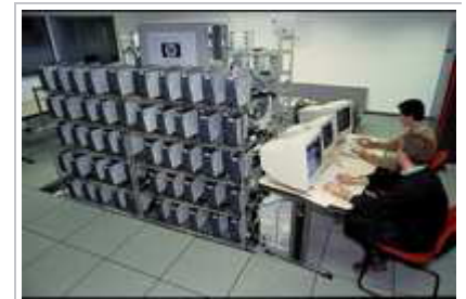
La grappe de PC conçue par HPLaboratories Grenoble et Inria en 2001

Une des voies de développement du calcul distribué réside dans le cloud computing. Certes très commercial aujourd'hui, il soulève toutefois de nombreux axes fondamentaux de recherche. Nous y travaillons depuis quelques années au sein d'Inria, particulièrement sur la gestion dynamique des ressources, la virtualisation, le stockage, et la gestion de l'énergie car des centaines de milliers de processeurs multi-cœurs doivent travailler efficacement et simultanément ensemble. Ce modèle va plus loin que la simulation numérique « classique » avec des applications dans tous les domaines. Il faut cependant être capable de gérer l'échelle de ces plateformes, leur dynamique et enfin les quantités de données à traiter.