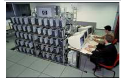
La grappe de PC conçue par HPLaboratories Grenoble et Inria en 2001

Une des voies de développement du calcul distribué réside dans le cloud computing. Certes très commercial aujourd'hui, il soulève toutefois de nombreux axes fondamentaux de recherche. Nous y travaillons depuis quelques années au sein d'Inria, particulièrement sur la gestion dynamique des ressources, la virtualisation, le stockage, et la gestion de l'énergie car des centaines de milliers de processeurs multi-cœurs doivent travailler efficacement et simultanément ensemble. Ce modèle va plus loin que la simulation numérique « classique » avec des applications dans tous les domaines. Il faut cependant être capable de gérer l'échelle de ces plateformes, leur dynamique et enfin les quantités de données à traiter.