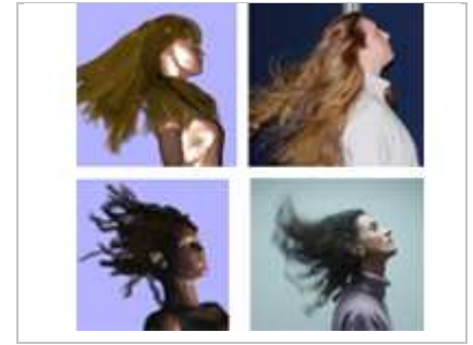
Modélisation de chevelures. Les étudiantes de l'équipe ont aussi servi de modèle.

De même les travaux sur les vêtements intéressent des entreprises de la mode, et les simulations de foule, proposées aujourd'hui par la Start-up Inria Golaem, peuvent intéresser des acteurs de domaines très variés, que ce soit pour simuler l'évacuation d'espaces publics (SNCF, architectes), ou pour s'entraîner en vue d'interventions dangereuses (pompiers, police, armée).