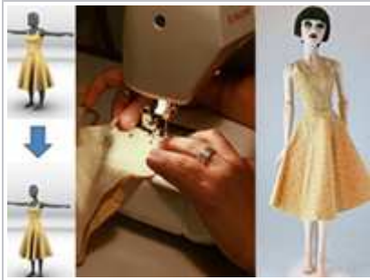
Adaptation automatique d'un vêtement à une nouvelle morphologie. Confection-test sur une poupée par une ingénieure de l'équipe !

La reconstruction du mouvement du squelette a fait un grand bond en avant lorsque la technique de capture du mouvement sur de vrais acteurs a supplanté, à partir des années 2000, les techniques manuelles d'interpolation et les approches par simulation. Notre équipe a contribué pour sa part aux autres couches du personnage 3D. A partir de 2003, nous avons développé des logiciels permettant d'ajouter du réalisme à la peau en faisant en sorte qu'elle puisse bouger, se déformer et faire des plis. C'était un perfectionnement du procédé de smooth skinning, inventé au début des années 1990, qui permettait d'habiller le squelette d'une peau lisse, plutôt que par des volumes rigides liés aux os qui avaient cours jusqu'alors. Nous avons également réalisé les premiers modèles dynamiques permettant de restituer l'épaisseur d'une chevelure animée (2002, 2006) et contribué à la prise en compte des vêtements, dont les plis et les collisions sont très complexes à simuler. En particulier, nous avons permis la synthèse de vêtements 3D à partir de croquis 2D (2007), l'ajout de plis dynamiques en temps-réel (2010) et le transfert de vêtements d'un personnage à un autre, en s'adaptant automatiquement au nouveau gabarit (2012). Un autre aspect important en animation de personnages est la