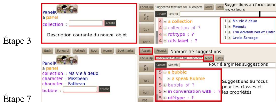
FIGURE 8 – Captures d’écran d’UTILIS des étapes 3 et 7 de l’indexation de la case de la figure 7.

qu’un utilisateur souhaite ajouter la case de la figure 7, nommée CaseK. Elle fait partie de la collection Ma vie à deux . Elle a deux personnages, Missbean et Fatbean et une bulle de dialogue dit par Missbean à Fatbean.