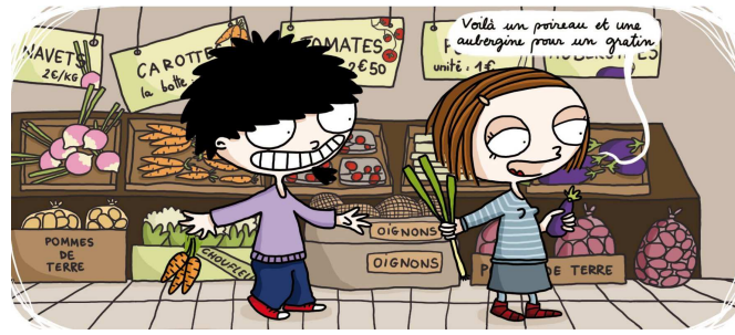
FIGURE 7 – Case de bande dessinée extraite de Ma vie à deux : Pour le meilleur et pour le pire ! , écrite et dessinée par Missbean, City Editions.