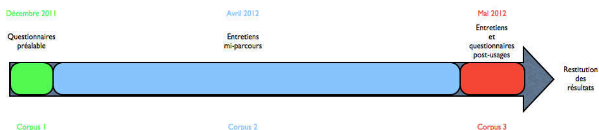
Figure 2 - Déroulement du projet

L'ensemble des interactions générées entre les structures (recherche, enseignement, administratives) va permettre de mettre au jour les différents processus à l'œuvre lors de l'utilisation du Lorfolio. Ci-dessous sont représentés les acteurs, les actions menées et les résultats attendus.