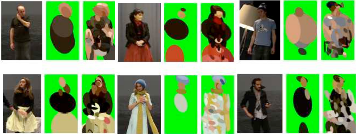
Figure 4: Indexation visuelle de 6 acteurs pendant les répétitions de “A l’ouest” 30 de Nathalie Fillion. Mise en scène de Nathalie Fillion. Coproduction - Théâtre du Rond-Point, Célestins, Théâtre de Lyon, Cie Théâtre du Baldaquin, AskUs , Le Gallia Théâtre-Saintes. Coproduction - Théâtre du Rond-Point, Célestins, Théâtre de Lyon, Cie Théâtre du Baldaquin, AskUs , Le Gallia Théâtre-Saintes.