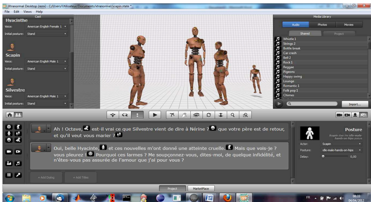
Figure 1: Partition scénique du système text-to-scene de Xtranormal. Le texte de la pièce est enrichi d'icônes qui représentent les actions scéniques.

La notation hiéroglyphique, proposée par Artaud 12 , a fait l'objet d'une tentative de formalisation pour l'annotation de vidéo à l'aide d'icônes 13 . Cependant, la complexité de la notation proposée semble disproportionnée par rapport aux possibilités et aux besoins de la mise en scène de théâtre. De plus, les caractères de cette notation ne sont ni disjoints, ni différenciés sémantiquement.