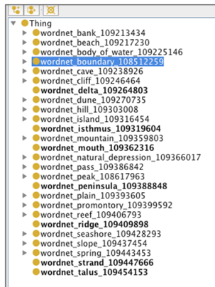
FIG. 3 – Bloc n°7

bayou isA lake flat isA plain lagoon isA lake llano isA plain loch isA lake moor isA plain branch isA stream lough isA lake penepain isA plain headstream isA stream oxbow lake isA lake snowfield isA plain rivulet isA stream reservoir isA lake steppe isA plain tidal river isA stream tarn isA lake tundra isA plain